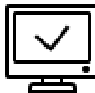
IT企業C社 (東証1部上場)