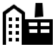
製造業A社 (東証1部上場)